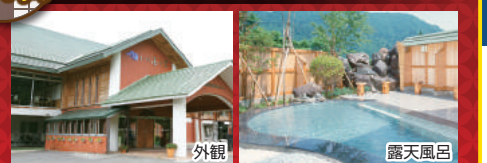
大自然の中にある露天風呂は、疲れた体を温め、 疲れを癒し、四季の景色もお楽しみいただけます。

■旅行代金[添乗員付] 浅草駅・北千住駅・春日部駅発 ◎4~6名様1室利用(和室) 大人 29,300円 小人 24,300円 ◎2~3名様1室利用(和室) 大人 29,800円 小人 24,800円 ◎1名様1室利用(和室) (限定3室) 大人 31,800円 ■出発日 2019年9月22日(日) ■最少催行人員 20名様 ■コースコード 096122