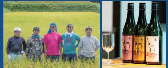
米作りからこだわった今人気の奥只見の米焼酎