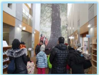
冬の只見を全身で味わえるツアーです。どうぞふるってご参加ください。

お申し込みは電話または電子メールでお願いします。 お申し込みの際には、①名前、②生年月日(年齢)、③連絡先、④住所 をお伝えいただきます。 ※電子メールでの申し込みの場合、申込日から3日以内に、下記メールアドレスより受信確認メールをお送りします。受信確認メールが届かない場合、お手数ですが電話にてお問い合わせください。 ※いただいた個人情報は、当ツアーの業務以外に使用いたしません。 ※主催者がツアー中に撮影した集合写真等は、鉄道利用促進のため広報誌等に掲載することもありますので、あらかじめご了承ください。