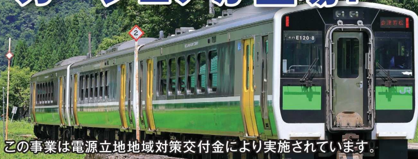
この事業は電源立地地域対策交付金により実施されています。