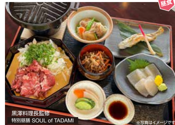
黒澤料理長監修 特別昼膳 SOUL of TADAMI