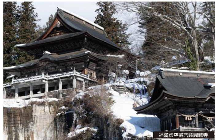
福満虚空蔵菩薩 圓藏寺