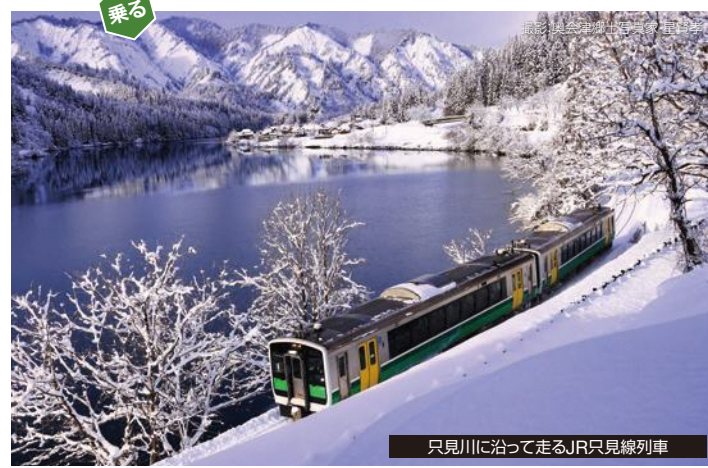
只見川に沿って走るJR只見線列車